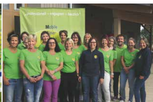
MUKKI Team Oberschwaben