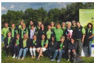
MUKKI Team Ulm

Die Mitarbeiter werden individuell und bedarfsgerecht eingesetzt und kontinuierlich weitergebildet.